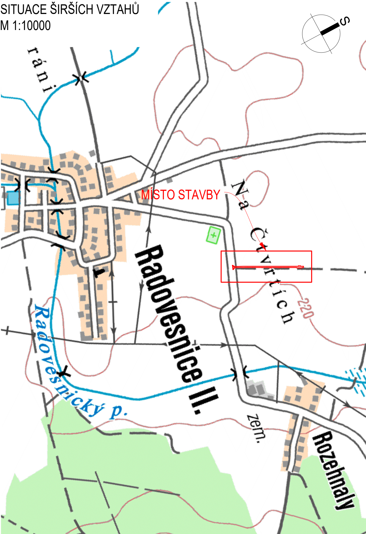
SITUACE ŠIRŠÍCH VZTAHŮ M 1:10000